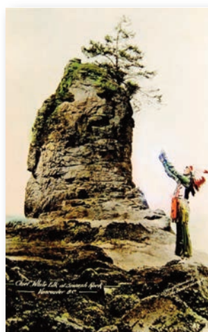
Due immagini significative di Cervo Bianco, tratte da internet e relative al periodo del suo ritorno in America, che mostrano come abbia continuato a svolgere la sua “missione”