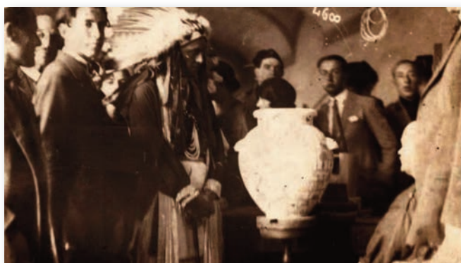
Qui il Capo indiano durante la visita alla Richard Ginori di Sesto

coli che, complici gerarchetti e notabili del posto, riuscirono ad invitarlo. Sei mesi di folle in delirio, fra nobili e popolani, bambini e generali, alti prelati e camicie nere, giornalisti e au-