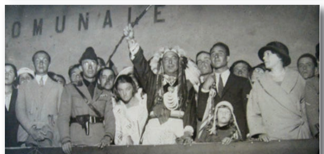
Qui e sopra: Cervo Bianco in un paio delle sue "esibizioni" pubbliche