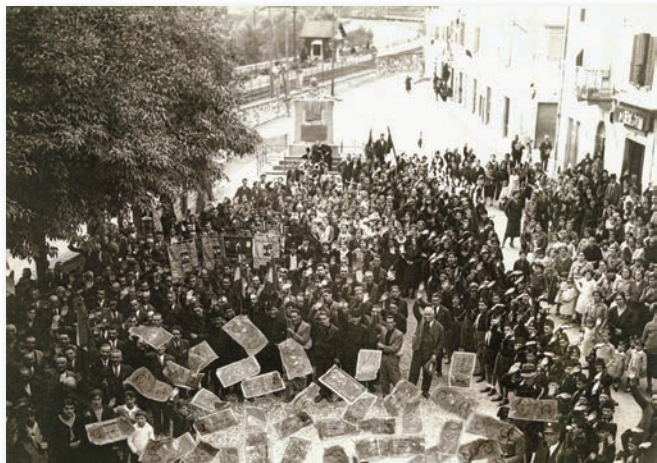
Una ricostruzione della probabile scena che concluse la visita del capo Cervo Bianco a Rignano, mentre distribuì denaro dalla terrazza del Comune

dini hanno riferito di aver sempre sentito raccontare dai propri genitori il giorno di questa visita del capo indiano , ricevuto dalle nostre autorità comunali con tutti gli onori. La sua venuta era stata annunciata e, al suo ritorno dalla visita al castello di Sammezzano, fu invitato a mostrarsi dal balcone del palazzo comunale e a parlare alla popolazione già radunata nella piazza di fronte, ovviamente preavvertita e già informata su cosa usava fare! Discorso che si concluse con il consueto lancio di denaro che, potenza dei particolari, i racconti precisano come furono avvantaggiati «i più svelti e i più vicini ...»! Il “numero”, pur esauritosi in breve, creò il solito trambusto a cui seguirono le richieste personali più insolite che, come altrove, lo costrinsero ad un precipitoso allontanamento per evitare un abbraccio troppo... pres-